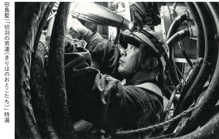
田島聖二「切羽の男達(きりはのおとこたち)」特選