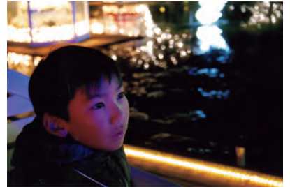
江黒夏乃子「その先」ヤング賞