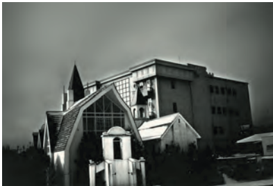
久保村 厚「秋の幻」特選