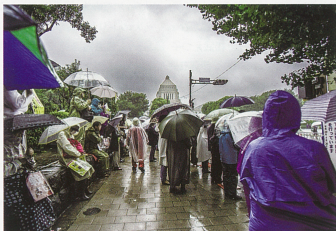
片岡英二「不安」入選