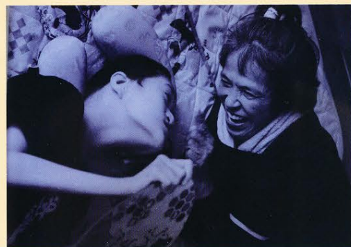
豆塚 猛「ともある」の仲間たち

花が美しく豊かに咲き乱れているさまを、写真にしています。その中で、明らかに輝いているものの中からのベストショット！